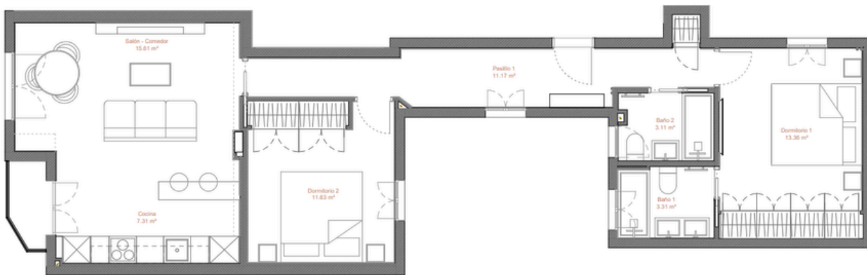
Tabla de superficies ER_PO