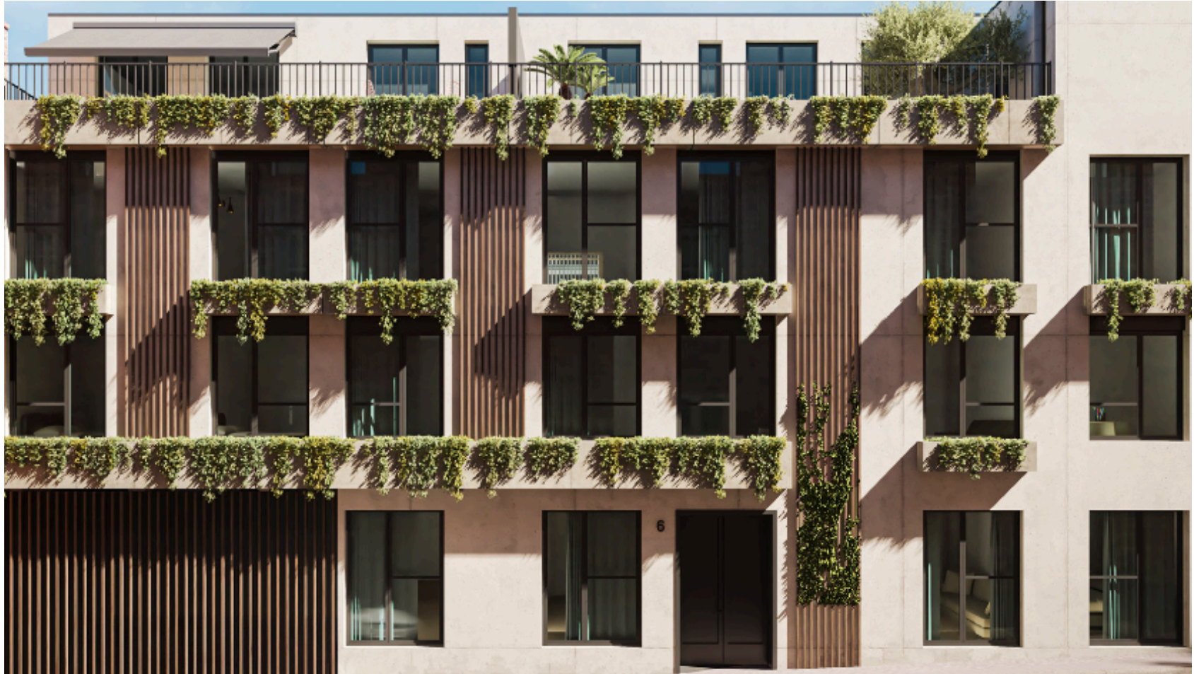
Memoria de Calidades